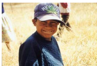
Proyecto Chihuahua Becas escolares