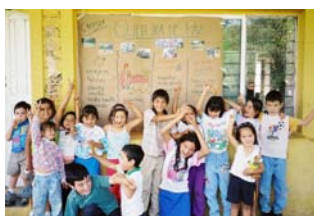
Proyecto Nuevo León Talleres de Formación