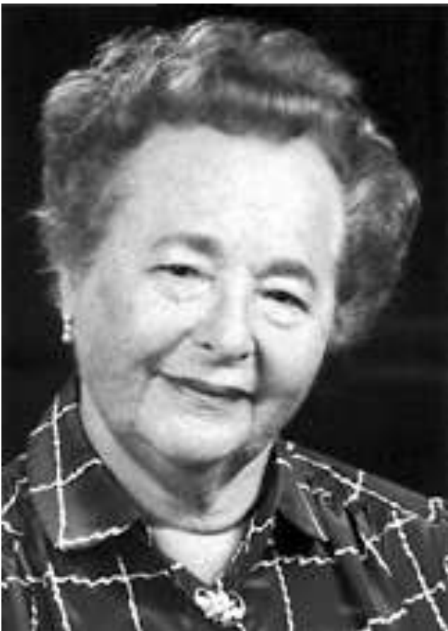
Gertrude Belle Elion

Trabajando con Hitchings, en 1950 sintetizaron una purina que interfiere con el crecimiento de las células de la leucemia, que hasta la fecha se utiliza para tratar a enfermedad. Encontraron también una variante del tratamiento, que dio como resultado un agente inmunosupresor que hizo posible el trasplante de órganos. En 1970, con la colaboración de su equipo crearon el primer tratamiento efectivo para el herpes, lo cual contribuyó al desarrollo de otros para la gota, lupus, malaria, entre otras enfermedades. Junto con Hitchings recibieron el premio Nobel de Medicina en 1988. Murió en Carolina del Norte el 21 de Febrero de 1999.