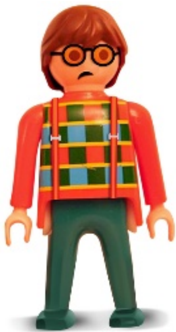
NINO O NIÑA AGREDIDOS

Características: • Débiles • Inseguros • Ansiosos • Tímidos • Con baja autoestima • Pasan mucho tiempo en casa • Reciben excesiva protección paterna • Son físicamente menos fuertes que los niños de su edad • Sufren el rechazo • Se aíslan • Son poco populares en sus escuelas.