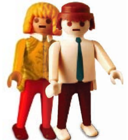
PADRES DE NIÑOS AGRESORES

Características: • Son, generalmente, papás ausentes de la educación de su hijo, quien maltrata a los demás como una forma de llamar la atención • No dedican tiempo suficiente para escuchar a sus hijos, no conviven con ellos, por lo que no saben descifrar sus necesidades • Suelen ser agresivos y muy impulsivos • Como sus hijos, son físicamente más fuertes y poseen una baja tolerancia ante las frustraciones • Son altamente sobreprotectores • Encubren o justifican con mentiras las malas conductas de sus hijos • Minimizan a las otras personas delante de sus hijos.