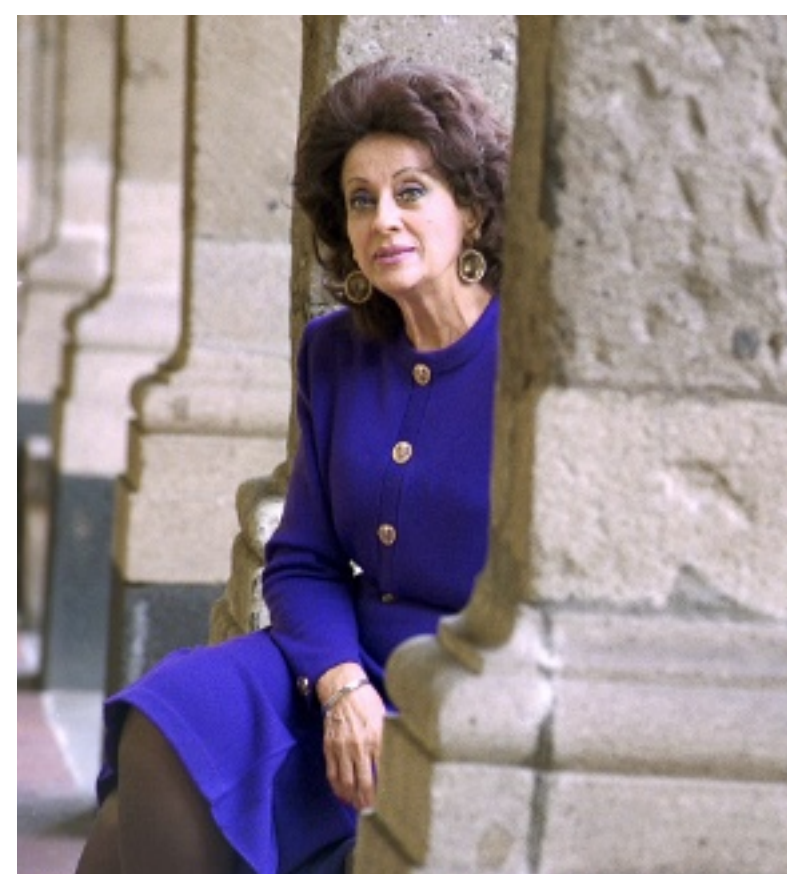
> Doña Carmen Romano, quien falleció en mayo del 2000, impulsó la creación de la Escuela Superior de Música y Danza de Monterrey.