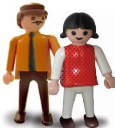
ACCIONES DEL MAESTRO

El acoso escolar es un tema que se escucha a menudo, ¿pero cuáles son las características de las personas involucradas en este fenómeno escolar?, ¿cómo responder a esta problemática? El también llamado bullying no es ajeno a los niños regiomontanos. Uno de cada 3 niños de colegios privados sufre agresiones físicas y/o emocionales, reveló un estudio local realizado por la Universidad Regiomontana en sus resultados preliminares. Los expertos consideran que pa-